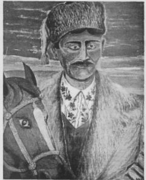
"Портрет дяді Якова" двп, олія, 1993 р.