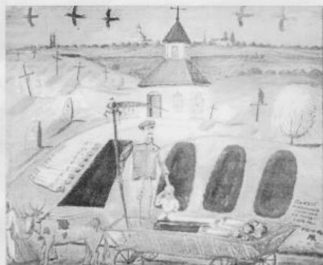
"Сталінський геноцид" полотно, олія, 1993р.