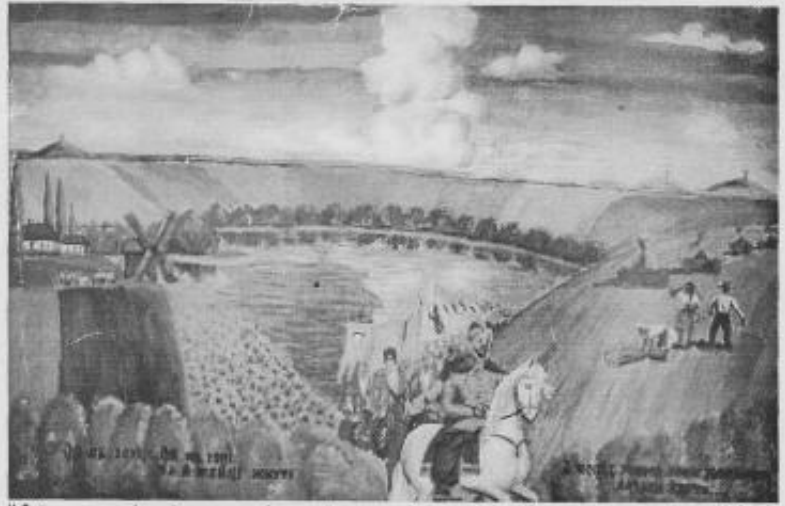
"Ой на горі, ой на горі та й жінці жінуть..." картон, олія, 1991р.

Народився у 1935 році в с.Вороному Маньківського р-ну Київської обл. 1954р. закінчив Вороменську середню школу. 1960-1962рр. навчався в м.Київі в студії образотворчого мистецтва при БК з-ду "Більшовик" у викладача Хусіда Г.Я. 1964-1970рр. навчався в Київському державному художньому інституті на заочному відділенні, факультет теорії та історії мистецтв. 1986р. переїхав жити у рідне село на Черкащині. Працював художником-оформлювачем на Березинському цукрозаводі. Тут розпочав творчо працювати, створив серію портретів своїх близьких родичів: "Портрет мами" 1991р., п-т "Батька пасічника" 1991-92рр., "Портрет дядька Якова" 1993р., "П-т брата Віктора" 1995р., п-т "П.Демурський та Охматівський хор" 1995р. Тематичні картини: "Ще не вмерла Україна" 1993р., "Т.Г.Шевченко в Чигирині" 1992р., "Т.Г.Шевченко малює Чуманську Богівку" 1992р., "Сталінський геноцид" 1993р. та пейзажі "Ой на горі, ой на горі та й жінці жінуть" 1993р., "Вид на с.Охматів" 1995р., "Стоїть гора високая" 1990р. та інші. З 1994 р. вийшов на пенсію і працює творчо. І серпня 1995р. в Музеї народної архітектури та побуту України була відкрита персональна виставка художніх творів майстра до 4ї річниці Незалежності України та 60-річчя від дня народження.