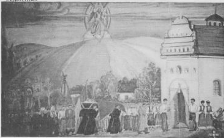
"Похорон Богдана Хмельницького" полотно, олія, 1995 р.